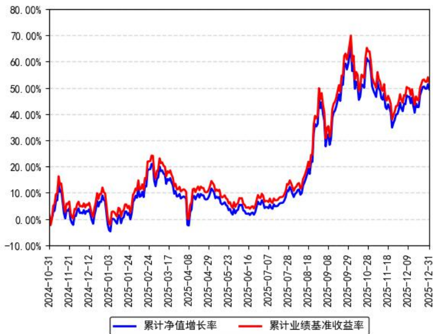
南方中证半导体行业精选ETF累计净值增长率与同期业绩比较基准收益率的历史走势对比图