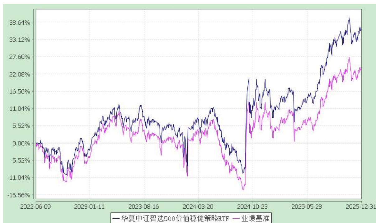
华夏中证智选 500 价值稳健策略交易型开放式指数证券投资基金 份额累计净值增长率与业绩比较基准收益率历史走势对比图 (2022 年 6 月 9 日至 2025 年 12 月 31 日)