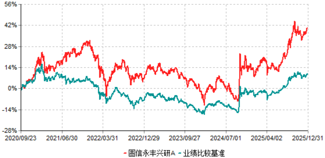
圆信永丰兴研A累计净值增长率与业绩比较基准收益率历史走势对比图 (2020年09月23日-2025年12月31日)