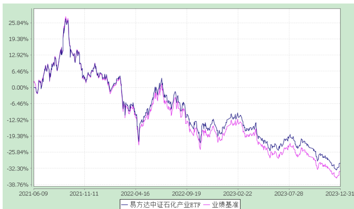
易方达中证石化产业交易型开放式指数证券投资基金 份额累计净值增长率与业绩比较基准收益率历史走势对比图 (2021年6月9日至2023年12月31日)

注：自基金合同生效至报告期末，基金份额净值增长率为-30.27%，同期业绩比较基准收益率为-33.57%。