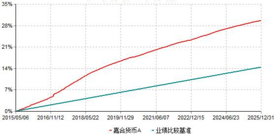
嘉合货币A累计净值收益率与业绩比较基准收益率历史走势对比图 (2015年05月06日-2025年12月31日)