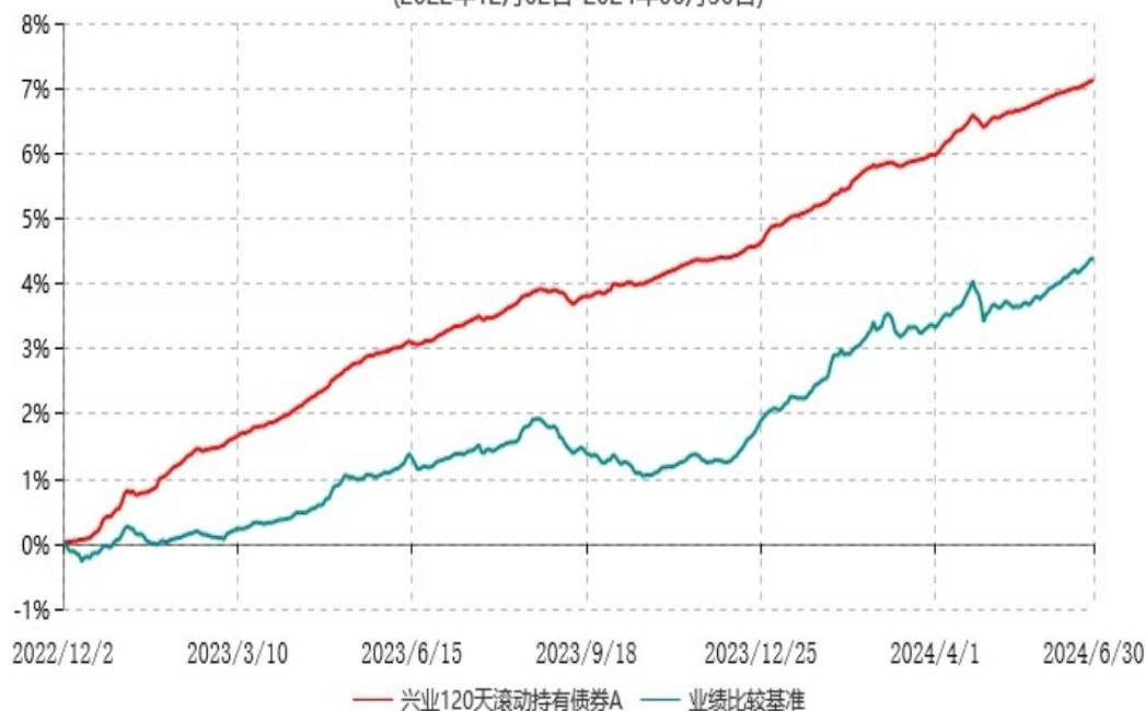
兴业120天滚动持有债券A累计净值增长率与业绩比较基准收益率历史走势对比图 (2022年12月02日-2024年06月30日)