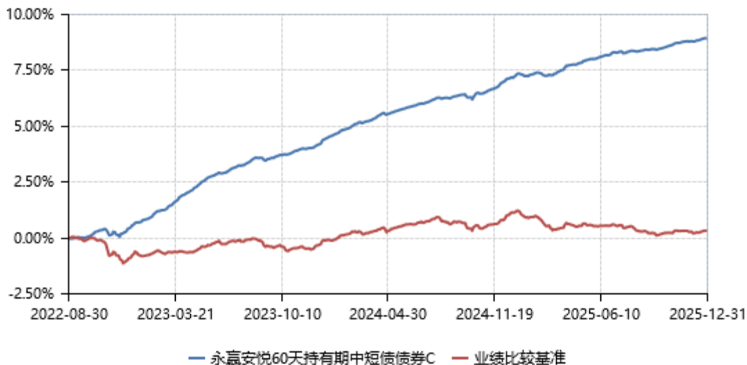
永赢安悦60天持有期中短债债券C累计净值收益率与业绩比较基准收益率历史走势对比图 (2022年08月30日-2025年12月31日)