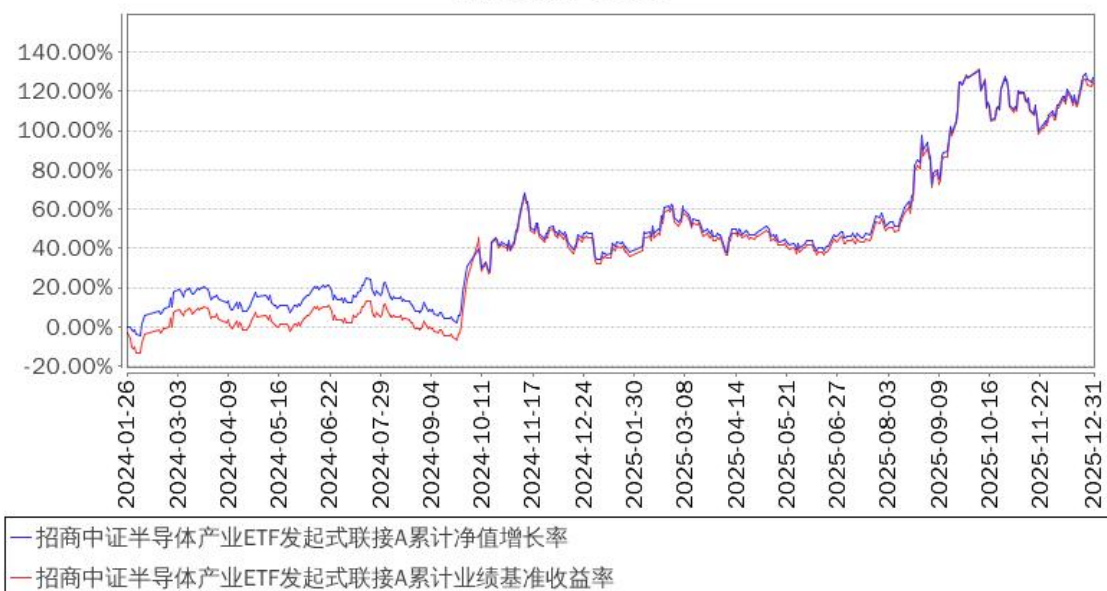
招商中证半导体产业ETF发起式联接A累计净值增长率与同期业绩比较基准收益率的历史走势对比图