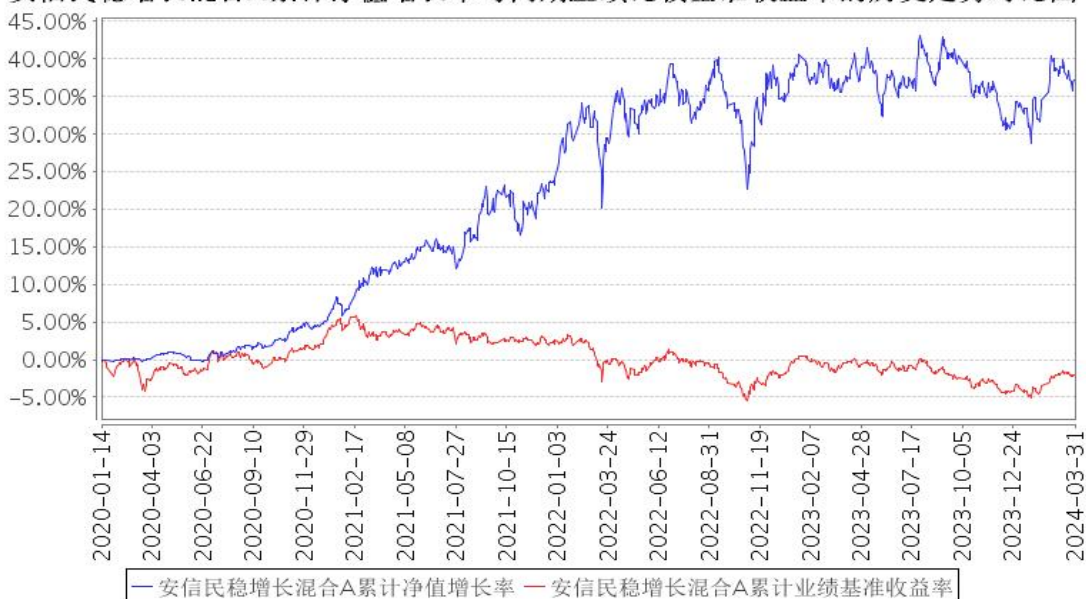
安信民稳增长混合A累计净值增长率与同期业绩比较基准收益率的历史走势对比图