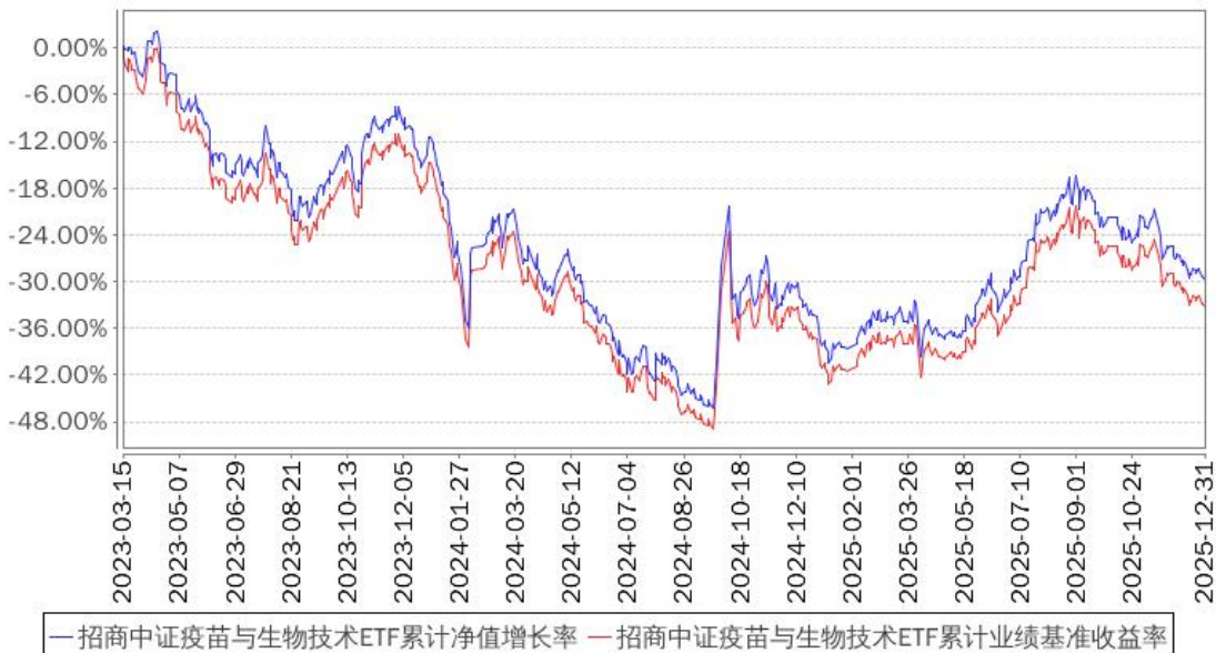
招商中证疫苗与生物技术ETF累计净值增长率与同期业绩比较基准收益率的历史走势对比图