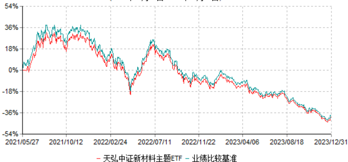
天弘中证新材料主题交易型开放式指数证券投资基金累计净值增长率与业绩比较基准收益率 历史走势对比图 (2021年05月27日-2023年12月31日)