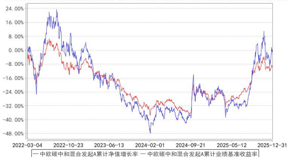
中欧碳中和混合发起A累计净值增长率与同期业绩比较基准收益率的历史走势对比图