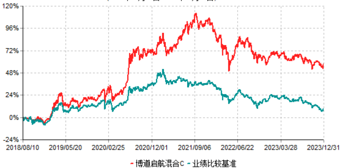
博道启航混合C累计净值增长率与业绩比较基准收益率历史走势对比图 (2018年08月10日-2023年12月31日)

注：本基金建仓期为自基金合同生效日起的6个月。截至建仓期结束，本基金各项资产配置比例符合基金合同及招募说明书有关投资比例的约定。