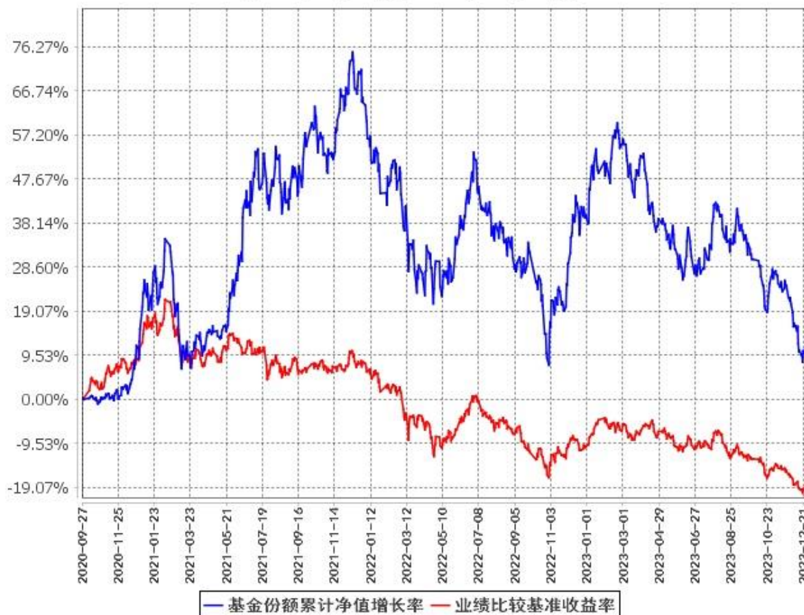
基金份额累计净值增长率与同期业绩比较基准收益率的历史走势对比图 (2020年9月27日至2023年12月31日)