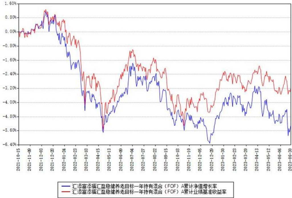
汇添富添福汇盈稳健养老目标一年持有混合 (FOF) Y 累计净值增长率与同期业绩基准收益率对比图