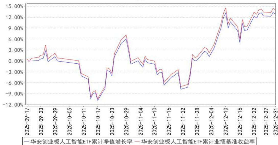
华安创业板人工智能ETF累计净值增长率与同期业绩比较基准收益率的历史走势对比图

注：本基金于 2025 年 9 月 17 日成立，截止本报告期末，本基金成立不满一年。