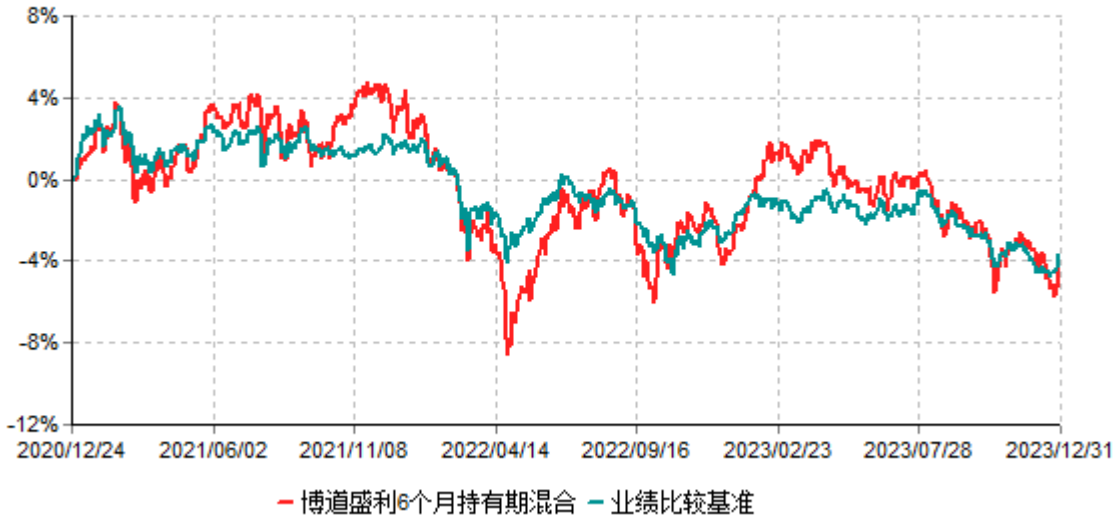
博道盛利6个月持有期混合型证券投资基金累计净值增长率与业绩比较基准收益率历史走势对比图 (2020年12月24日-2023年12月31日)

注：本基金建仓期为自基金合同生效日起的6个月。截至建仓期结束，本基金各项资产配置比例符合基金合同及招募说明书有关投资比例的约定。