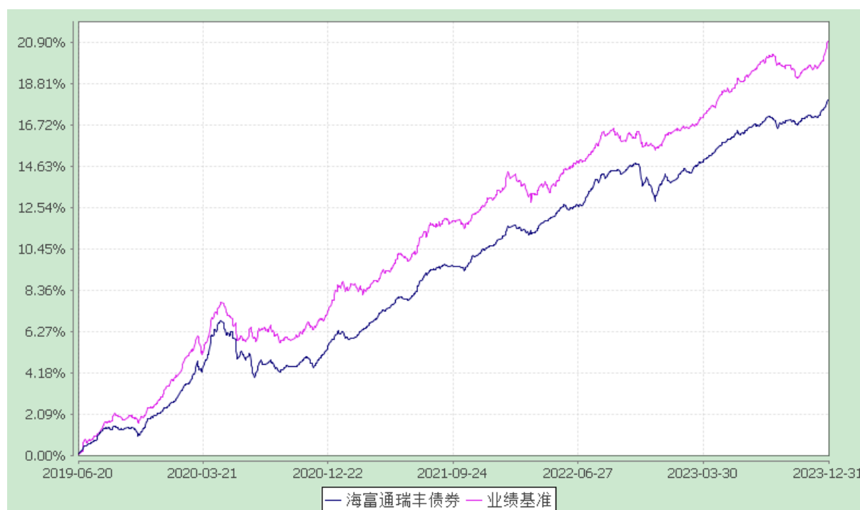
海富通瑞丰债券型证券投资基金 份额累计净值增长率与业绩比较基准收益率的历史走势对比图 (2019年6月20日至2023年12月31日)

注：本基金于2019年6月20日进行了转型。按照本基金合同规定，本基金建仓期为自基金合同生效起六个月。建仓期结束时本基金的各项投资比例已达到基金合同第十二部分（二）投资范围、（四）投资限制中规定的各项比例。