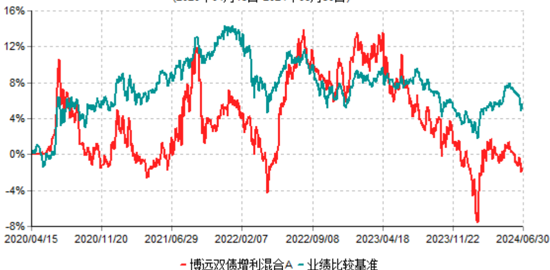
博远双债增利混合A累计净值增长率与业绩比较基准收益率历史走势对比图 (2020年04月15日-2024年06月30日)