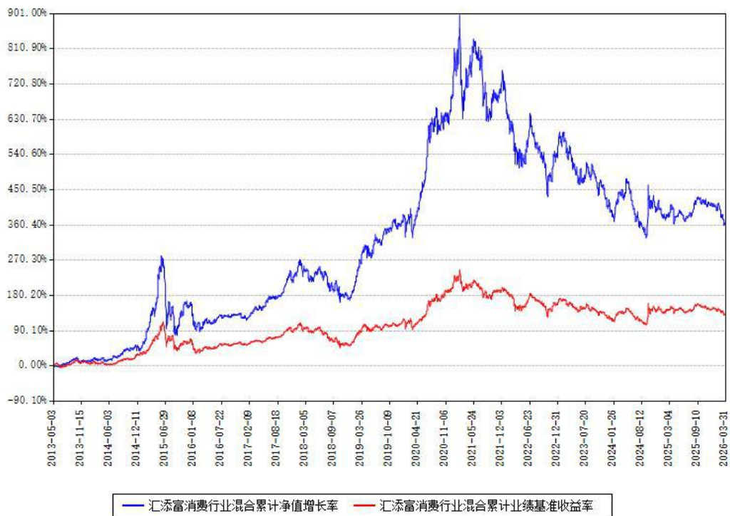
汇添富消费行业混合累计净值增长率与同期业绩基准收益率对比图

(二)自基金合同生效以来基金累计净值增长率变动及其与同期业绩比较基准收益率变动的比较图