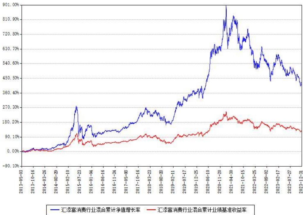
汇添富消费行业混合累计净值增长率与同期业绩比较基准收益率对比图

注：本基金建仓期为本《基金合同》生效之日（2013年05月03日）起6个月，建仓期结束时各项资产配置比例符合合同约定。