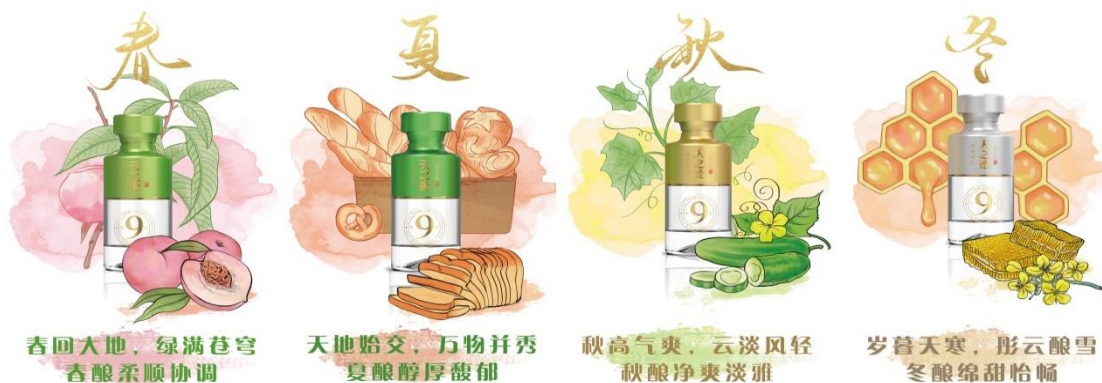
- 天之德“顺天应时·自然好酒”产品理念可视觉解读 -