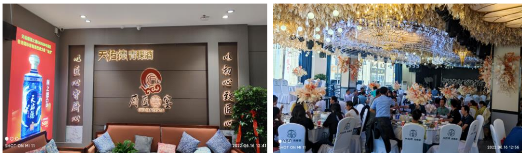
- 天佑德青稞酒联合餐厅 -

(2) 建立天佑德用户沟通执行标准，高效传递产品品牌价值：以天佑德品牌四大工具为基础，结合营销转型中用户沟通的需求，建立了“天佑德酿造生态圈+令人惊讶的演示+产品品鉴互动”的执行标准，并联合青海卫视录制价值演示样板演说视频，在天佑德体验馆、品鉴会及青稞酒文化节活动期间，进行充分展示运用。通过实践检验，产品品牌的用户沟通标准，有效的提升了用户对于天佑德品牌及产品的认知度。