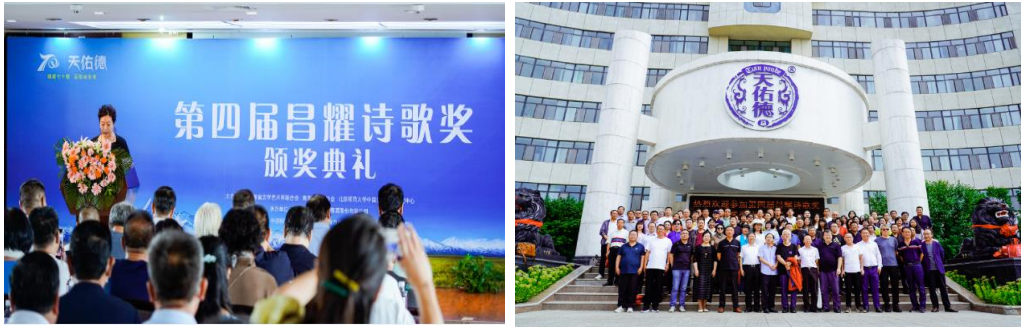
- 2022 年第四届昌耀诗歌节 -

2022 年，在青稞酒文化节、环湖赛、昌耀诗歌节等大型品牌 IP 活动及天佑德体验馆建设、联合餐厅开发、令人惊讶的演示等工作中都得到了充分实践，并得到了较好效果。