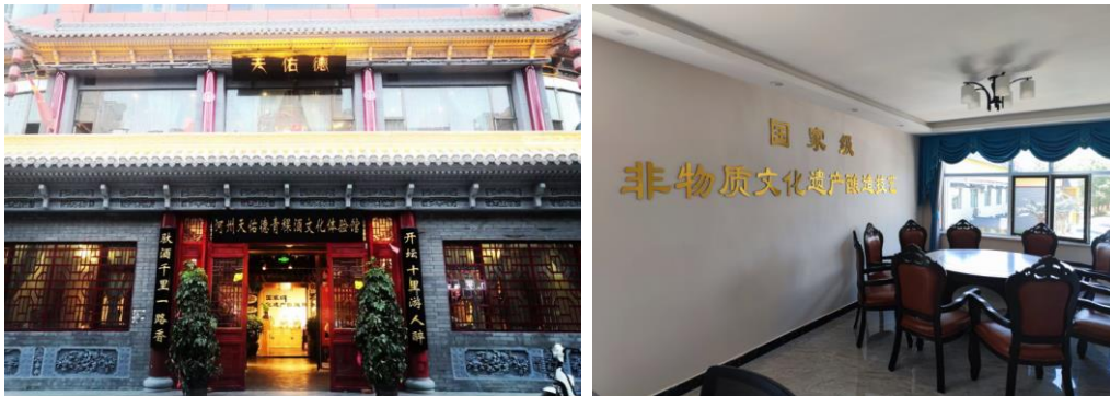
- 天佑德青稞酒文化体验馆 -

2022 年，在青稞酒文化节、环湖赛、昌耀诗歌节等大型品牌 IP 活动及天佑德体验馆建设、联合餐厅开发、令人惊讶的演示等工作中都得到了充分实践，并得到了较好效果。