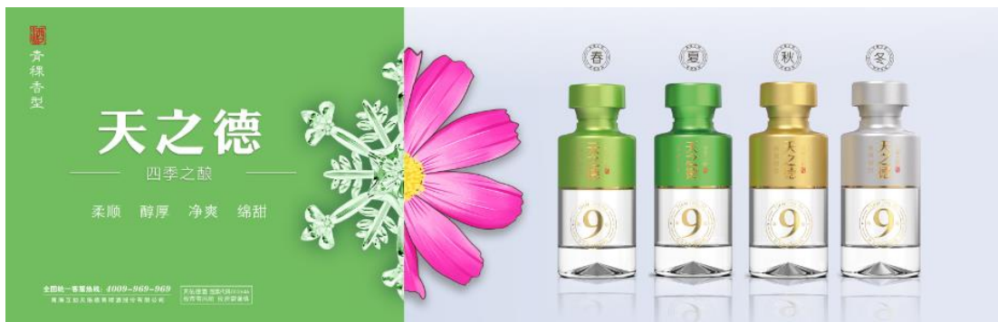
- 天之德四季之酿 产品主视觉图 -

天之德产品以“春酿柔顺、夏酿醇厚、秋酿净爽、冬酿绵甜”的四季不间断酿酒的独特工艺和风味价值要点。