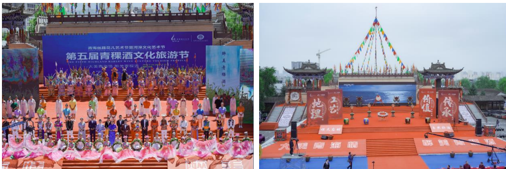
-2022 年第五届青稞酒文化旅游节-

（1）品牌价值内容管理标准化工具化，奠定品牌发展理论基础：依照公司品牌发展的需要，对公司品牌资产进行系统化的整理，按照年度营销转型工作以及奢侈品五教模型建设的需要，系统化对品牌价值进行梳理，对天酿工艺、天酿文化价值进行提炼，以品牌文化，企业文化，天酿文化，圣地文化和青藏文化构成文化天佑德营销体系，并以此为品牌理论基础创建了“品牌管理四工具”，为“营销变革”战略推进及用户运维工作开展提供了顶层品牌规划。