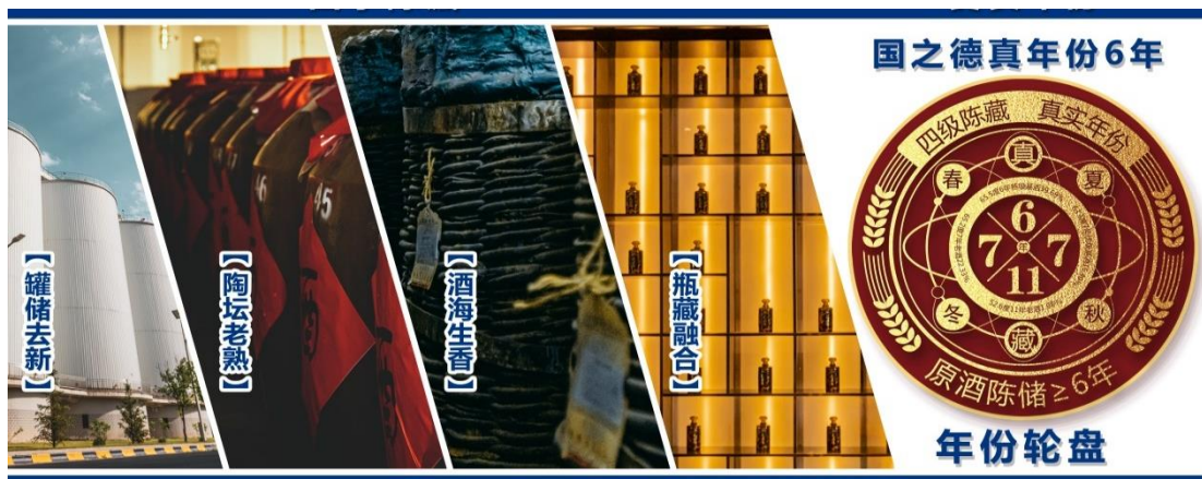
- 国之德“四级陈藏·真实年份”产品理念可视觉解读 -

天之德产品以“春酿柔顺、夏酿醇厚、秋酿净爽、冬酿绵甜”的四季不间断酿酒的独特工艺和风味价值要点。