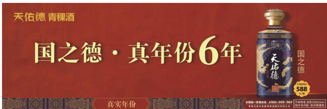
- 国之德真年份6年 产品主视觉图 -