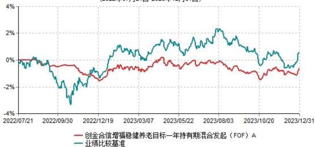
创金合信增福稳健养老目标一年持有期混合发起（FOF）A累计净值增长率与业绩比较基准收益率历史走势对比图 (2022年07月21日-2023年12月31日)