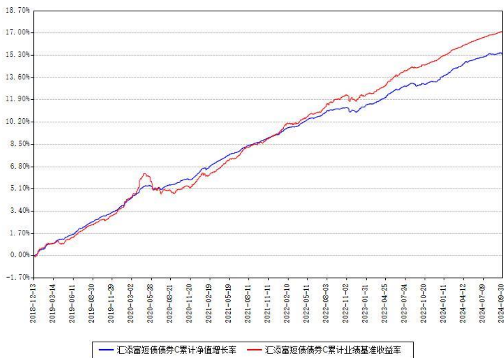
汇添富短债债券C累计净值增长率与同期业绩基准收益率对比图