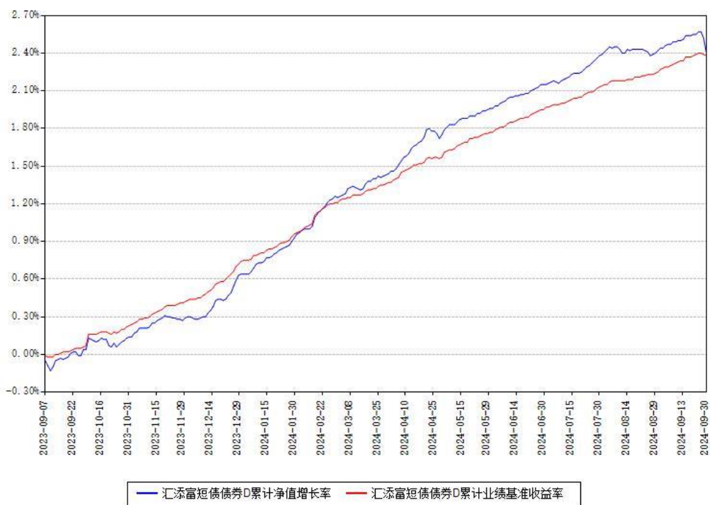
汇添富短债债券D累计净值增长率与同期业绩基准收益率对比图