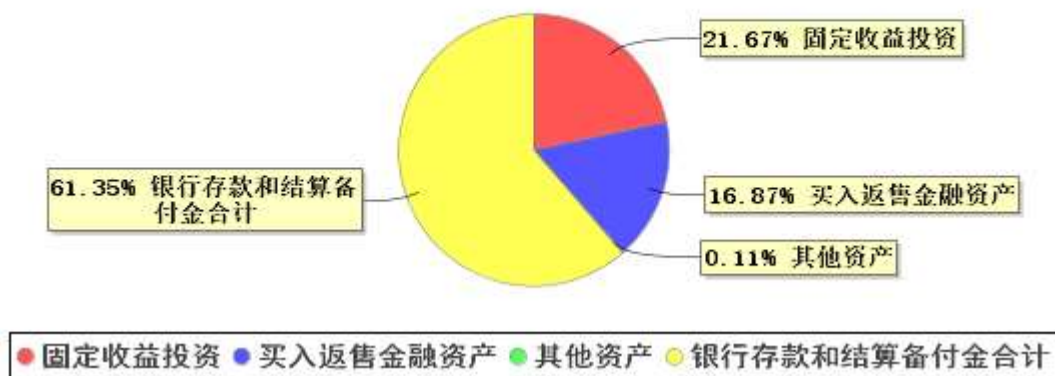
投资组合资产配置图表(2024年3月31日)