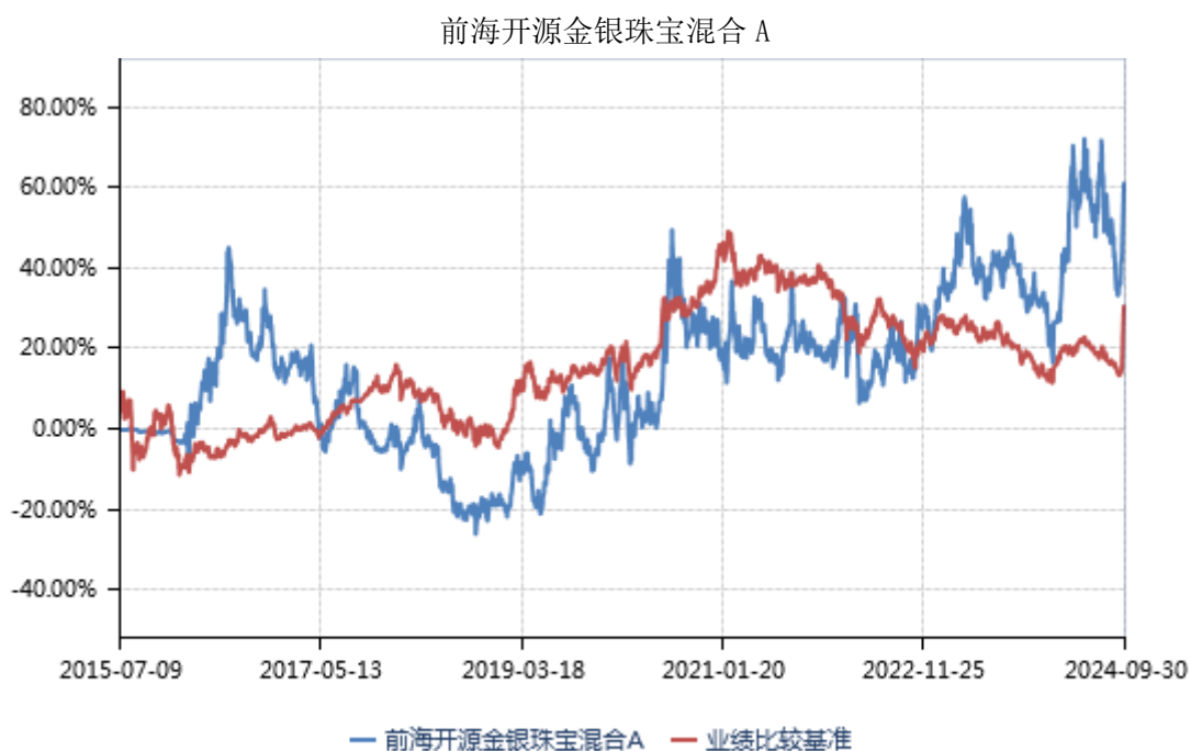
前海开源金银珠宝混合 C