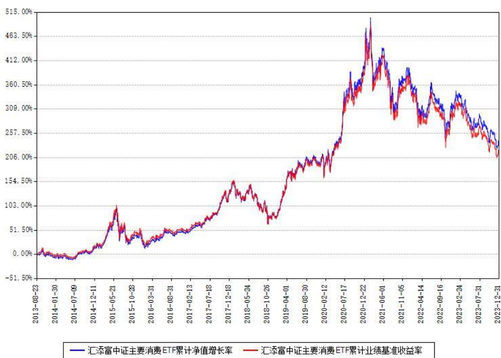
汇添富中证主要消费ETF累计净值增长率与同期业绩基准收益率对比图

注：本基金建仓期为本《基金合同》生效之日（2013年08月23日）起3个月，建仓期结束时各项资产配置比例符合合同约定。