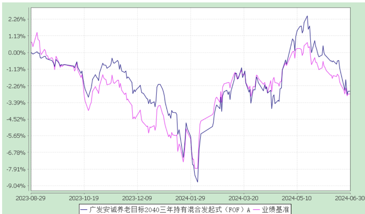
广发安诚养老目标 2040 三年持有混合发起式（FOF）Y