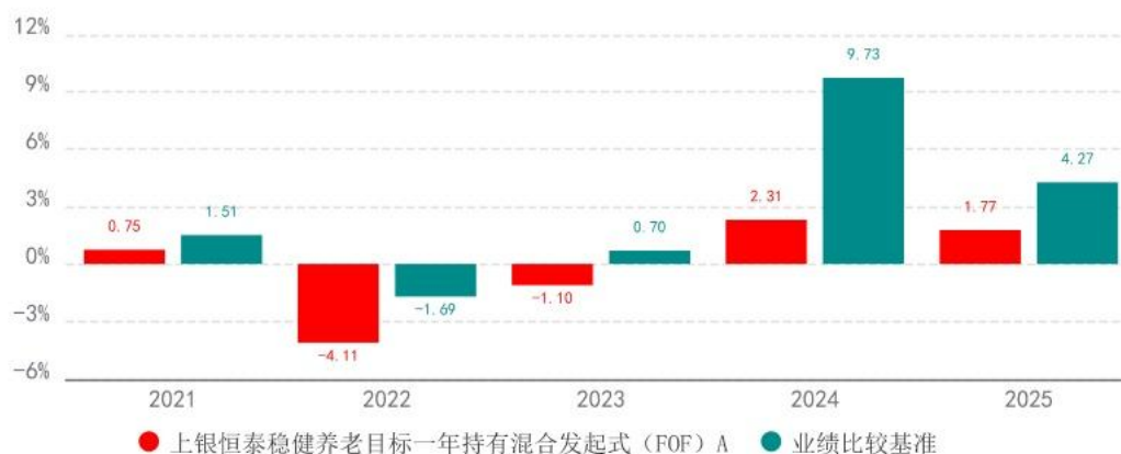
基金的过往业绩不代表未来表现，数据截止日：2025年12月31日