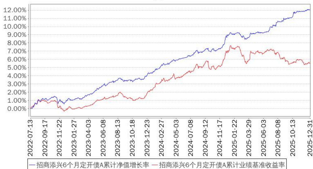
招商添兴6个月定开债A累计净值增长率与同期业绩比较基准收益率的历史走势对比图