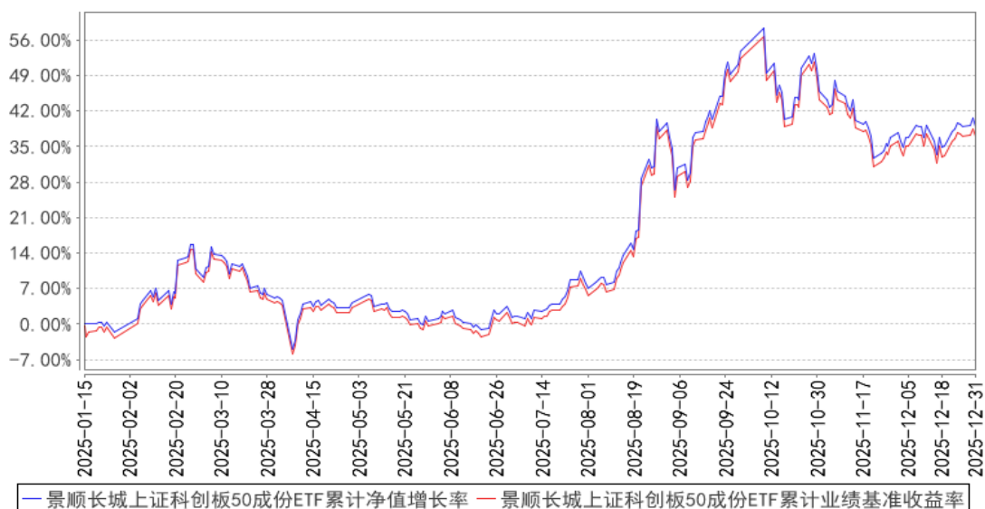
景顺长城上证科创板50成份ETF累计净值增长率与同期业绩比较基准收益率的历史走势对比图

注：基金的投资组合比例为：基金投资于标的指数成份股及备选成份股的资产不低于基金资产净值的90%，且不低于非现金基金资产的80%。本基金每个交易日日终在扣除股指期货合约、股票期权合约需缴纳的交易保证金后，应当保持不低于交易保证金一倍的现金，其中，现金不包括结算备付金、存出保证金和应收申购款等。本基金的建仓期为自2025年1月15日基金合同生效日起6个月。建仓期结束时，本基金投资组合达到上述投资组合比例的要求。报告期末距离建仓结束期未满一年。基金合同生效日（2025年1月15日）起至本报告期末不满一年。