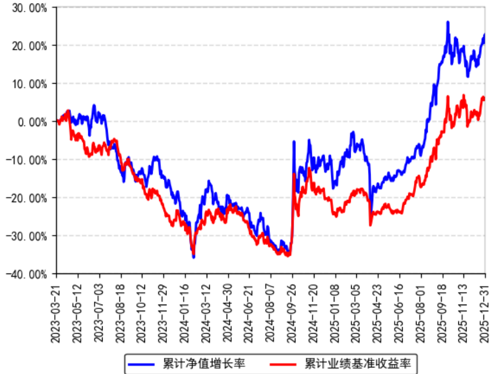
南方新材料股票发起A累计净值增长率与同期业绩比较基准收益率的历史走势对比图