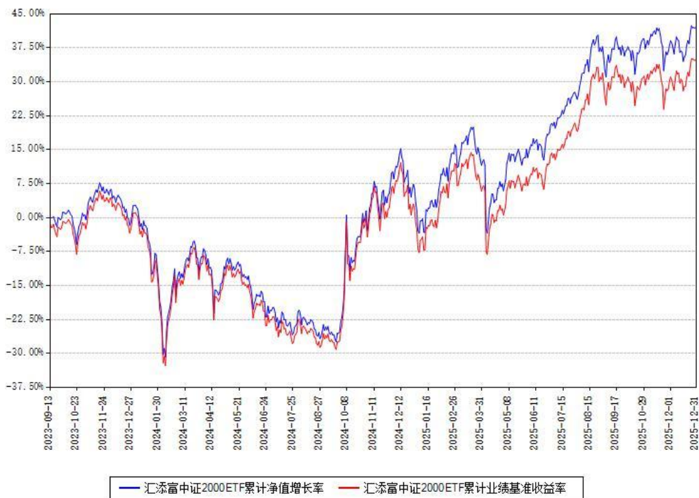
汇添富中证2000ETF累计净值增长率与同期业绩基准收益率对比图

注：本基金建仓期为本《基金合同》生效之日（2023年09月13日）起6个月，建仓期结束时各项资产配置比例符合合同约定。