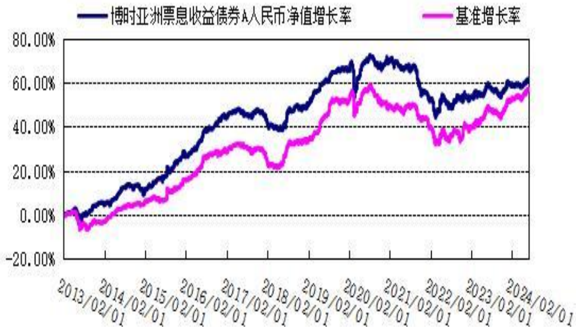
份额累计净值增长率与业绩比较基准收益率的历史走势对比图