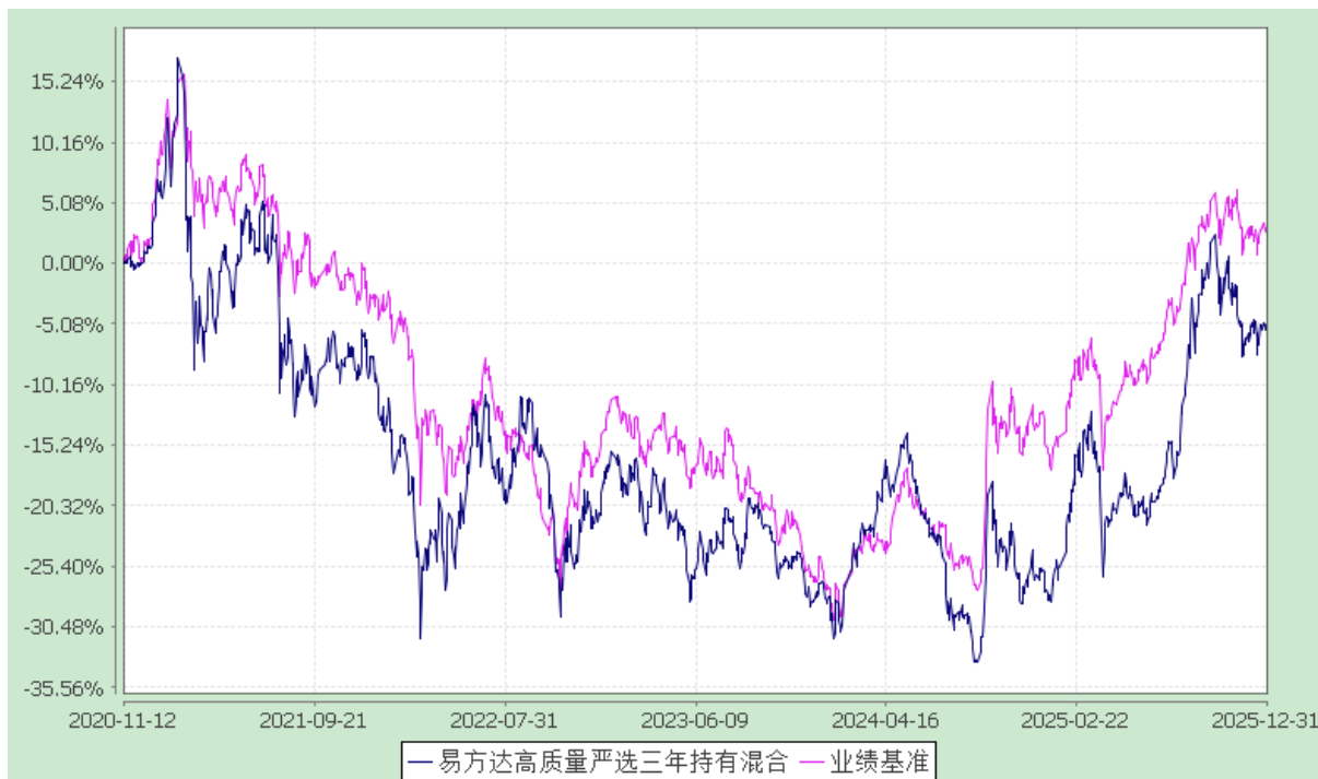
易方达高质量严选三年持有期混合型证券投资基金 份额累计净值增长率与业绩比较基准收益率历史走势对比图 (2020 年 11 月 12 日至 2025 年 12 月 31 日)