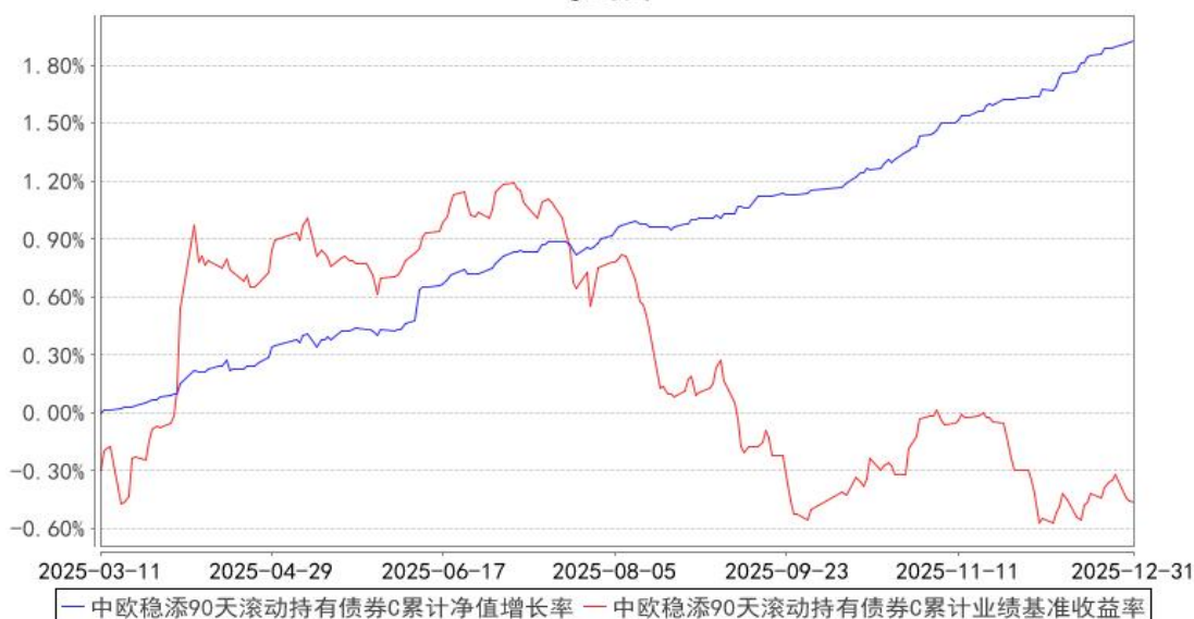
中欧稳添90天滚动持有债券C累计净值增长率与同期业绩比较基准收益率的历史走势对比图

注：本基金基金合同生效日期为 2025 年 3 月 11 日，自基金合同生效日起到本报告期末不满一年，按基金合同的规定，本基金自基金合同生效起六个月为建仓期，建仓期结束时各项资产配置比例已经符合基金合同约定。