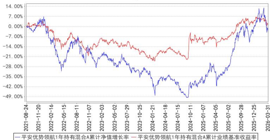
平安优势领航1年持有混合A累计净值增长率与同期业绩比较基准收益率的历史走势对比图