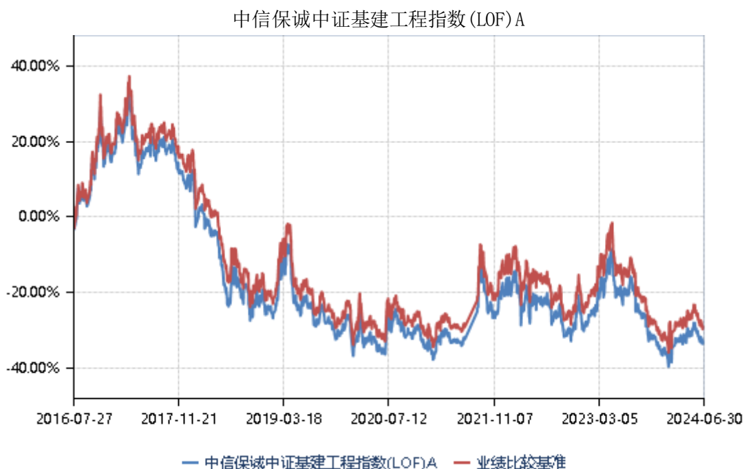
中信保诚中证建设工程指数(LOF)C