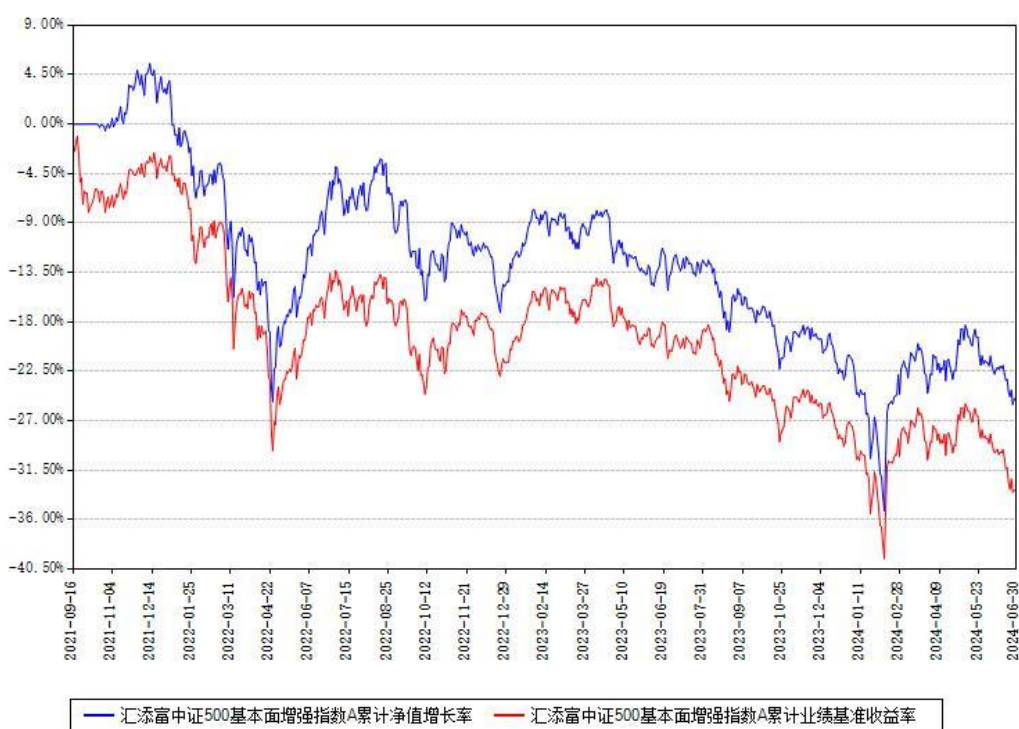
汇添富中证500基本面增强指数A累计净值增长率与同期业绩基准收益率对比图