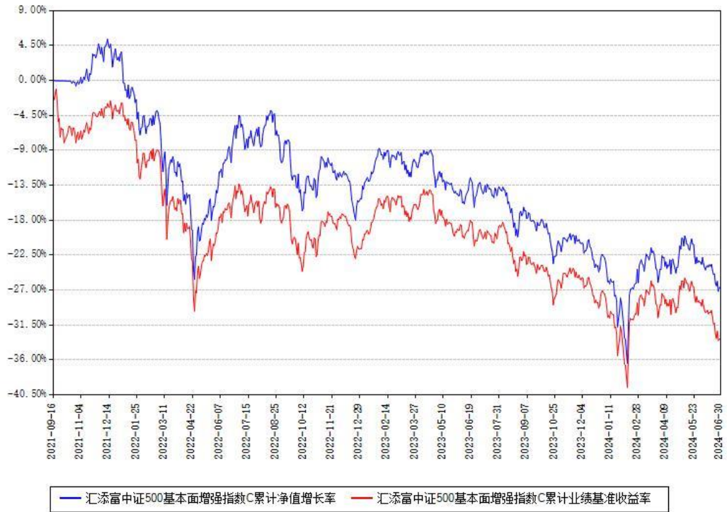
汇添富中证500基本面增强指数C累计净值增长率与同期业绩基准收益率对比图