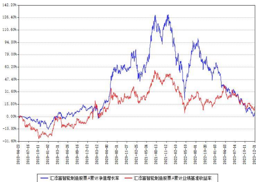
汇添富智能制造股票A累计净值增长率与同期业绩基准收益率对比图

(二)自基金合同生效以来基金累计净值增长率变动及其与同期业绩比较基准收益率变动的比较图