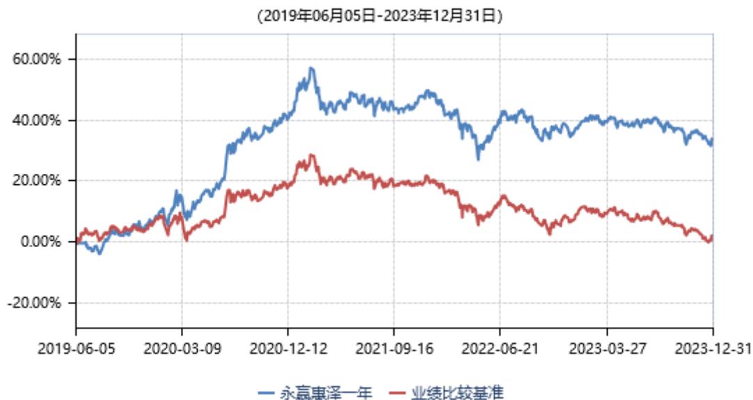
永赢惠泽一年定期开放灵活配置混合型发起式证券投资基金累计净值收益率与业绩比较基准收益率历史走势对比