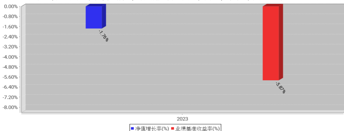
港股红利ETF基金每年净值增长率与同期业绩比较基准收益率的对比图 (2023年12月31日)

注：1、本基金基金合同于2023年3月30日生效。合同生效当年不满完整自然年度的，按实际期限计算净值增长率。