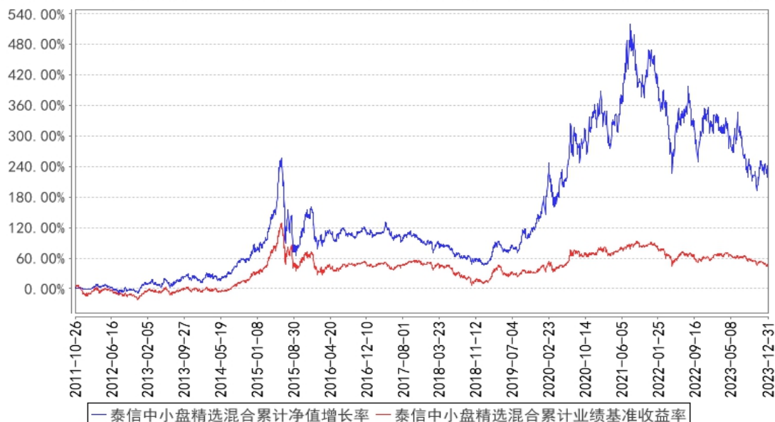
泰信中小盘精选混合累计净值增长率与同期业绩比较基准收益率的历史走势对比图

注：1、本基金合同于 2011 年 10 月 26 日正式生效。本基金自 2015 年 8 月 7 日起变更为混合型基金。