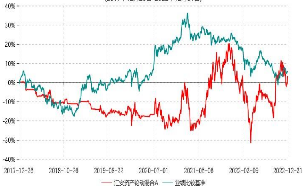
汇安资产轮动混合C累计净值增长率与业绩比较基准收益率历史走势对比图