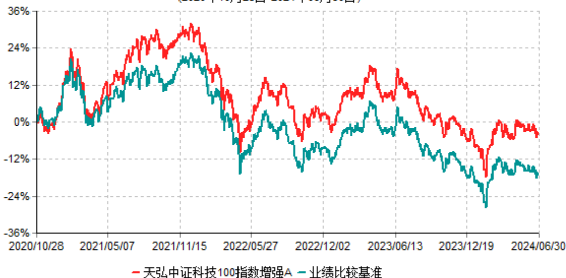
天弘中证科技100指数增强A累计净值增长率与业绩比较基准收益率历史走势对比图 (2020年10月28日-2024年06月30日)