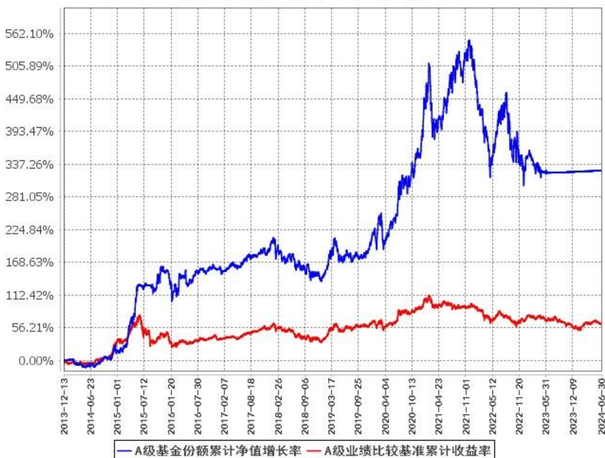
A级基金份额累计净值增长率与同期业绩比较基准收益率的历史走势对比图 (2013年12月13日至2024年6月30日)