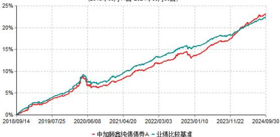
中加颐鑫纯债债券A累计净值增长率与业绩比较基准收益率历史走势对比图 (2018年09月14日-2024年09月30日)