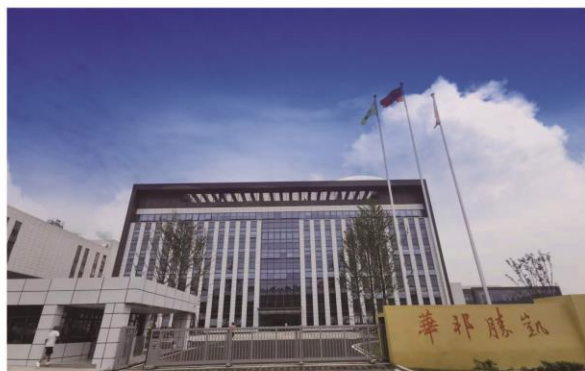
华邦胜凯原料药基地