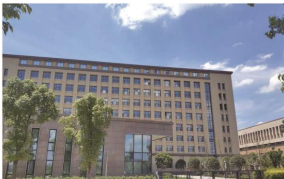
华邦制药水土生产基地