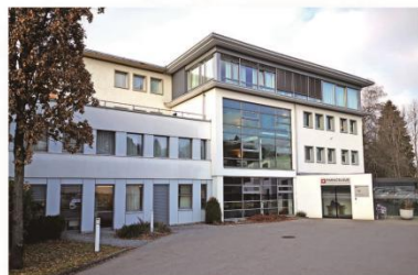
瑞士巴拉塞尔生物诊疗中心

专注于骨科、内科、运动伤害、心脑血管疾病和静脉疾病等领域的康复治疗，拥有成熟高效的康复治疗体系。