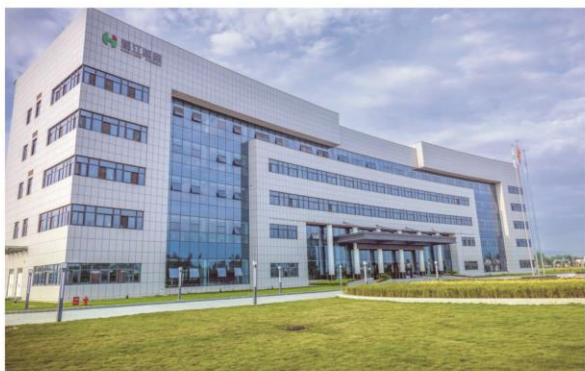
汉江国际原料药基地