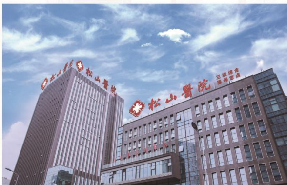
重庆松山医院（原重庆北部宽仁医院）

是由公司出资建设，集医教研于一体的非营利性三级综合医院，编制床位 1000 张，共开设临床科室及平台科室 30 多个。2022 年，就诊人次实现稳步快速增长、医疗水平不断提升。新增 23 个特色门诊，累计服务人数超 150 万人次；重庆松山医院互联网医院获批上线，全方位满足日常医疗服务需求，打造一站式互联网 + 医疗健康服务。