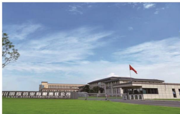
明欣制剂生产基地