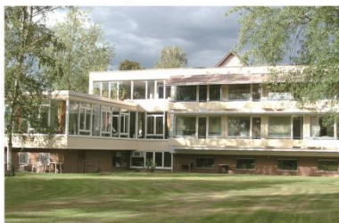
德国莱茵康复医院

专注于骨科、内科、运动伤害、心脑血管疾病和静脉疾病等领域的康复治疗，拥有成熟高效的康复治疗体系。