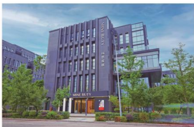
玛恩皮肤医院（连锁）

是一家三级康复专科医院，批复床位 300 张。在临床康复一体化的基础上，重点打造了运动康复、神经康复、骨与关节康复、心肺康复、儿童康复等多个优势学科。2022 年，北京华生康复医院正式获批医保资质，成为北京市医保定点医疗机构；新增床位 200 张，新开高压氧舱、健康体检中心、发热门诊、ICU 等科室，完成成人残联定点康复医院审核备案。