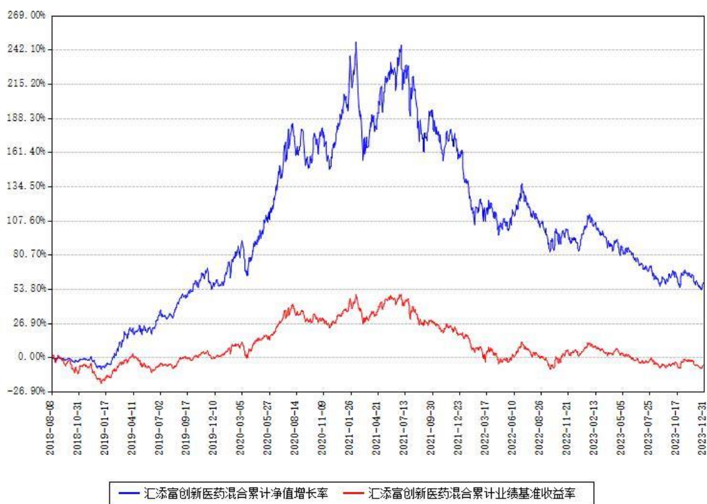
汇添富创新医药混合累计净值增长率与同期业绩比较基准收益率对比图

注：本基金建仓期为本《基金合同》生效之日（2018年08月08日）起6个月，建仓期结束时各项资产配置比例符合合同约定。