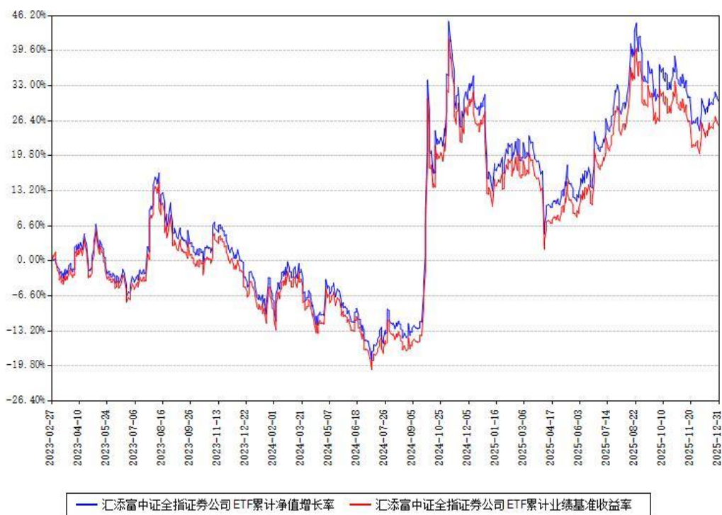
汇添富中证全指证券公司ETF累计净值增长率与同期业绩基准收益率对比图

注：本基金建仓期为本《基金合同》生效之日（2023年02月27日）起6个月，建仓期结束时各项资产配置比例符合合同约定。